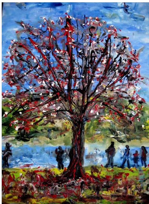
Τάσσα Μπιτσάνη, Ταξίδι, Λάδι- Ακρυλικό, 70Χ50