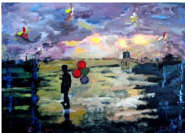
Τάσσα Μπιτσάνη, Πωλητής Ελπίδων, 70X100, Λάδι-Ακρυλικό