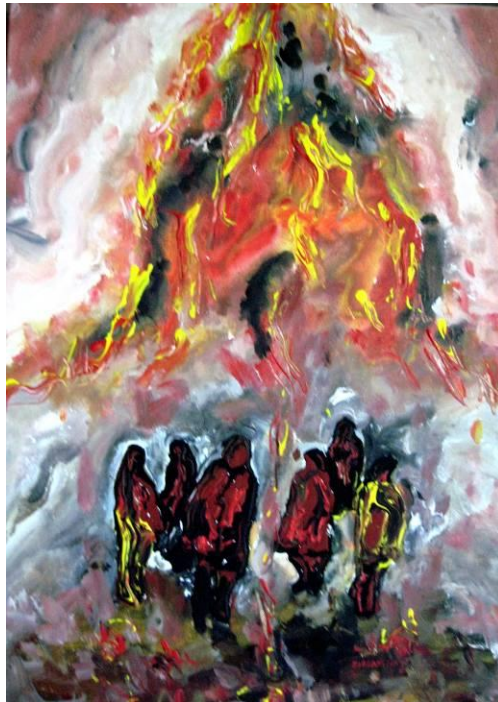
Τάσσα Μπιτσάνη, Περιπλανώμενοι (Wanderers), III, Ακρυλικό