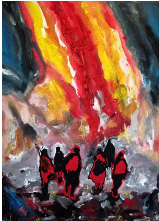
Τάσα Μπιτσάνη, Περιπλανώμενοι (Wanderers), ΙΙ, Ακρυλικό

Ξένος τώρα βρίσκεσαι στο ίδιο σου το σπίτι. Όλα σου τα κλέψανε. Όνειρα και ελπίδες πέταξαν όλα μακριά προς το πιο λαμπρό αστέρι. Και εσύ μόνος έμεινες πίσω στο απόλυτο σκοτάδι.