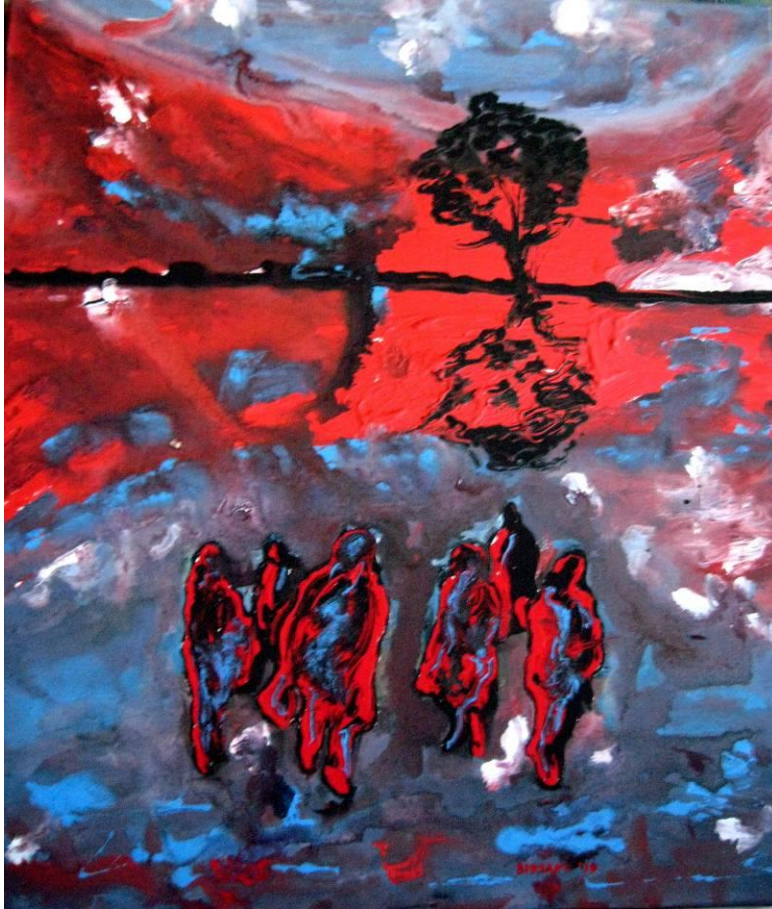
Τάσσα Μπιτσάνη, Περιπλανώμενοι, Λάδι-Ακρυλικό

ΗΜΕΡΟΜΗΝΙΑ ΔΙΑΓΩΝΙΣΜΟΥ 22 Φεβρουαρίου 2020