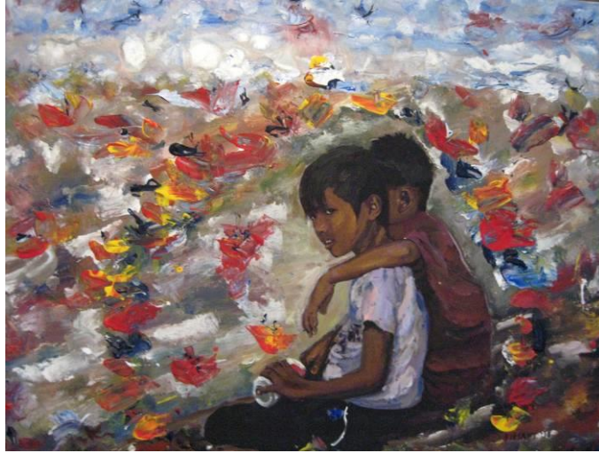
Τάσσα Μπιτσάνη, Παιδιά του δρόμου. Για πάντα φίλοι, 80Χ60, Μικτή Τεχνική