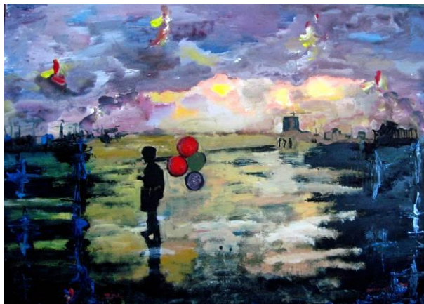
Τάσσα Μπιτσάνη, Πωλητής Ελπίδων, 70X100, Λάδι-Ακρυλικό