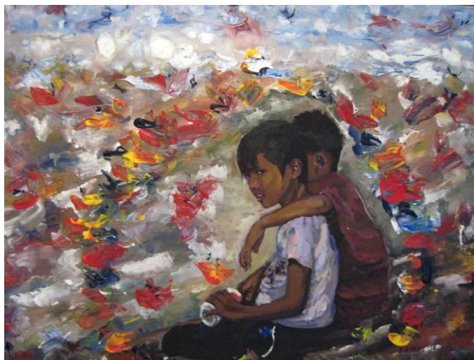
Τάσσα Μπιτσάνη, Παιδιά του δρόμου. Για πάντα φίλοι, 80Χ60, Μικτή Τεχνική