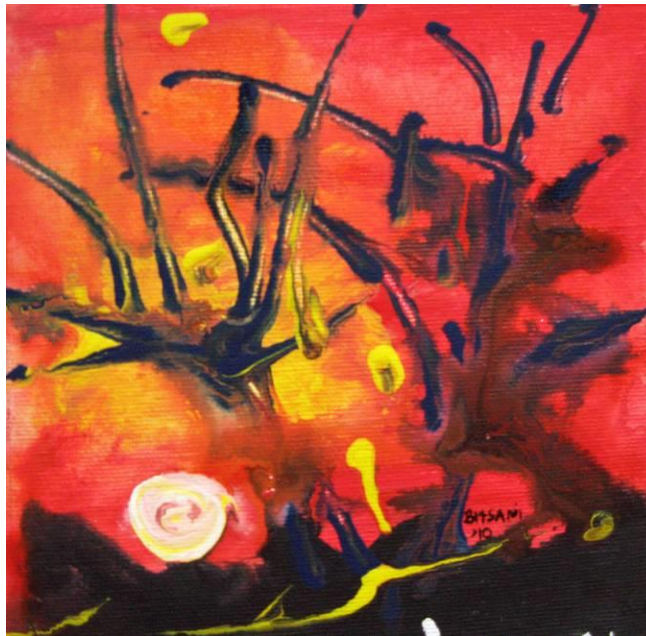
Τάσσα Μπιτσάνη, Μαγικό τοπίο ΙΙΙ, 14Χ14, Λάδι - Ακρυλικό