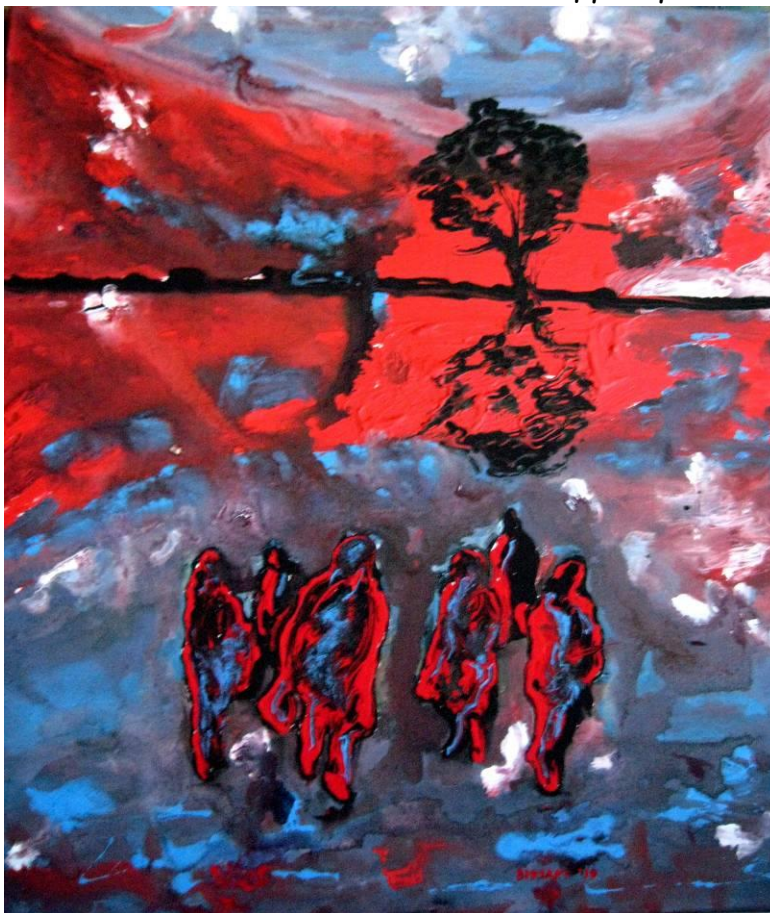
Τάσσα Μπιτσάνη, Περιπλανώμενοι, Λάδι-Ακρυλικό

ΗΜΕΡΟΜΗΝΙΑ ΔΙΑΓΩΝΙΣΜΟΥ 22 Φεβρουαρίου 2020